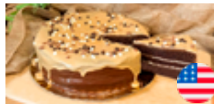
757 PCP Torta americana Kinder 14 porciones