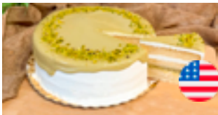
758 PCP Torta americana de pistacho 14 porciones