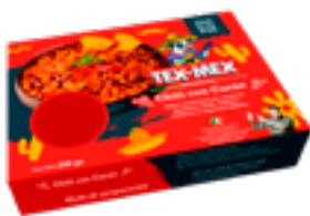
37 NTM Chili con Carne Carne picada de cerdo y ternera, frijoles y especias mexicanas