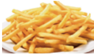
1201 BE Patata cerilla fina 7 mm

Descubre nuestra selección de patatas prefritas ultracongeladas, listas para preparar en cualquier momento y en solo unos minutos.