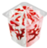
604 PCP Vasito nata, fresa y sirope. Menú 125 ml.