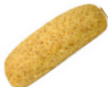
27 PCP Flautín rico en fibra sin sal 85 gr./ud.