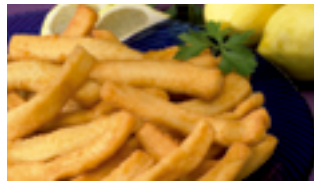
1421 FR Raba de calamar premium (70% calamar - 30% pan)