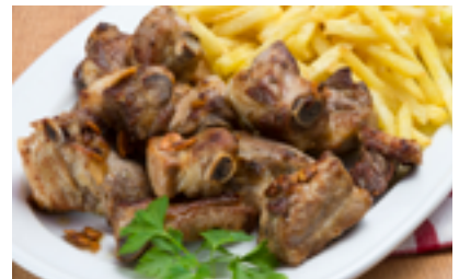
1714 CG Costilla de cerdo en tacos. Adobados con ajo, sal y aceite de oliva