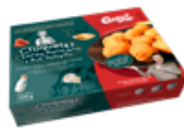
CRET 06 Croquetas de chorizo asturiano y ajo tostado