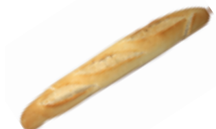
148 PCP Barra de medio 400 gr./ud.