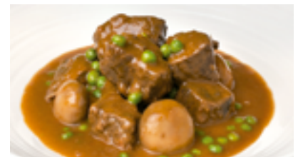
15 CP Ternera asturiana gobernada a la sidra con guisantes y champiñones (receta tradicional asturiana)