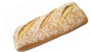
233 PCP Chapata artesana 460 gr./ud.