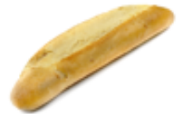
119 PCP Barra sin sal 280 gr./ud.