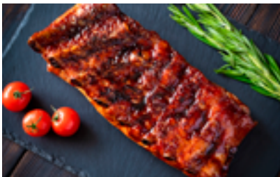
705 PR D'Gochu Ribs Barbacoa Costillar de cerdo BBQ al bourbon