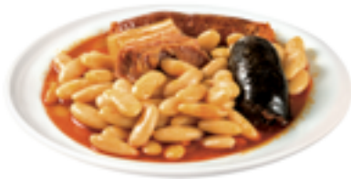
Fabada asturiana con su compango (chorizo, morcilla y tocino)