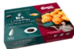
CRET 09 Croquetas de calamares en su tinta