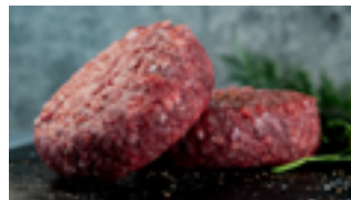
712 HB Hamburguesa artesana vacuno 160 gr./ud