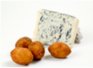
503 CR Croquetas artesanas de queso azul