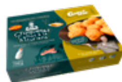
CRET 03 Croquetas de callos a la asturiana