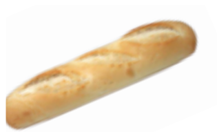
132 PCP Baguette 150 gr./ud.