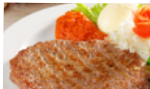
1003 HB Hamburguesa cerdo y ternera HORECA MIXTA