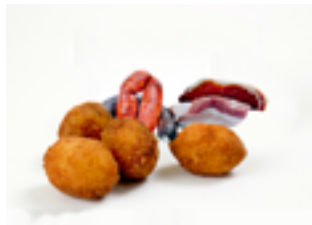
510 CR Croquetas artesanas de compango asturiano (chorizo, morcilla, y tocino)