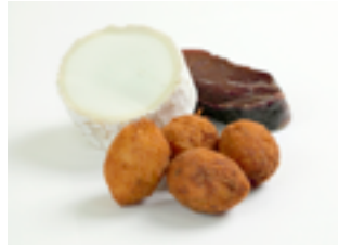
505 CR Croquetas artesanas de cecina y queso de cabra