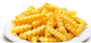
1209 BE Patata ondulada