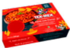
CRET 01 Croquetas de boletus y jamón ibérico