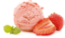
9 HEL Helado de fresa