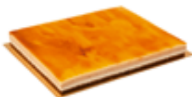
15 PA Plancha San Marcos 30 porciones