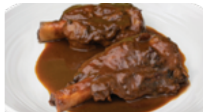
9 CP Codillo de cerdo guisado con salsa de cerveza tostada