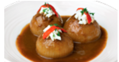
Cebollas confitadas rellenas de bonito del norte y pisto