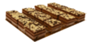
23 PA Plancha 3 chocolates 30 porciones