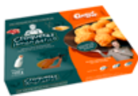
CRET 05 Croquetas de jamón Ibérico