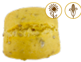
178 PCP Minipanes sabores de maíz y pipas de girasol y calabaza 55 gr./ud.