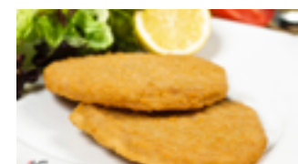
1101 HB Hamburguesa pechuga de pollo quality (Empanada) 120-125 gr./ud.