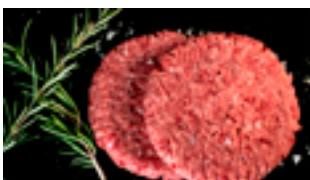
709 HB Hamburguesa Angus Premium 180 gr./ud