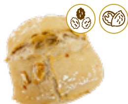
177 PCP Minipanes sabores de pasas y nueces 55 gr./ud.