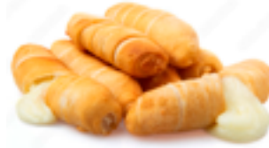
800 PCP Tequeños rellenos de queso 40 gr./ud.