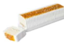
605 PCP Tarta helada al whisky 1,5 l.