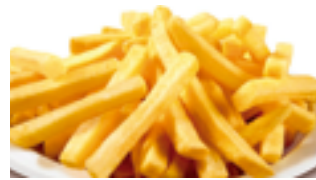
1203 BE Patata 3/8 10 mm