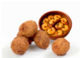
513 CR Croquetas artesanas de gambas al ajillo