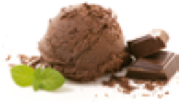
10 HEL Helado de chocolate

Helados cremosos y llenos de sabor, elaborados para ofrecer una experiencia irresistible en cada cucharada. El broche perfecto.