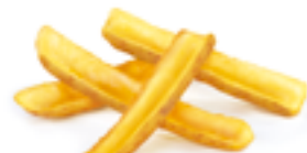
1212 BE Patata teja (Especial dipear y salsas)