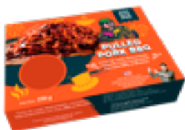
CRET 04 Croquetas de pulled pork bites BBQ