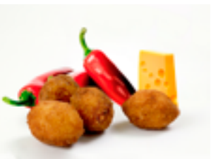
514 CR Croquetas jalapeños y queso Cheddar