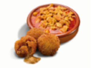
508 CR Croquetas artesanas de callos a la asturiana