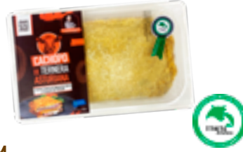
6 NTM Cecina de León y queso de cabra