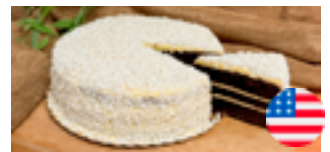
729 PCP Torta americana chocolate blanco y leche condensada 14 porciones