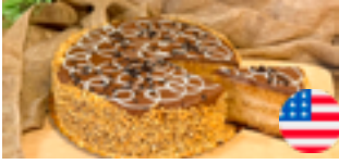
777 PCP Torta americana Toffe 14 porciones