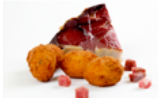
501 CR Croquetas artesanas de jamón de bodega