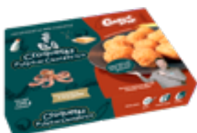
CRET 10 Croquetas de pulpo del Cantábrico