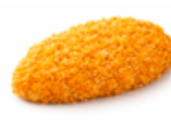
706 HB Crispy chicken: hamburguesa pechuga de pollo (Rebozado crujiente de cereales) 100 gr./ud