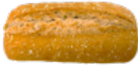
144 PCP Chapata artesana 100 gr./ud.