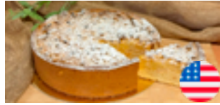
738 PCP Torta americana de manzana 14 porciones