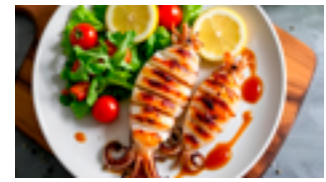
1608 PE Vaina de calamar limpia (Pota)