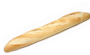
17 PCP Baguette 250 gr./ud.