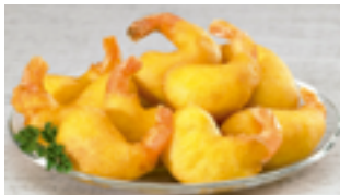
1417 FR Langostinos gabardina con alioli de lima (Gran tamaño y crujiente rebozado)