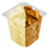
603 PCP Vasito vainilla chocolate. Menú 125 ml.