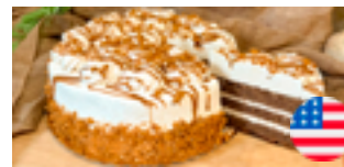
756 PCP Torta americana Lotus 14 porciones