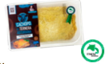
7 NTM Chosco de Tineo IGP y queso Cabrales