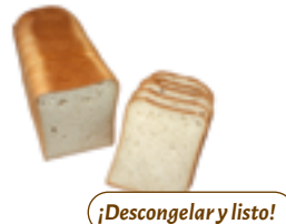
64 PCP Pan molde 11x11 cm. 800 gr./ud.