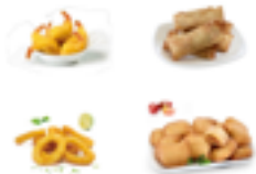
747 FR Mix compuesto por (Anilla rebozada, langostino a la gabardina, mini empanadillas de carne y rollito de primavera)