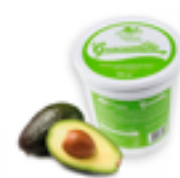
708 MX Guacamole congelado en bote (Aguacate, tomate, cebolla, sal, cilantro, ajo)