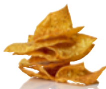
789 MX Nachos de maíz (Totopos)

Disfruta de la cocina mexicana y de todo su sabor gracias a nuestro increíble surtido de los productos más emblemáticos de su gastronomía.