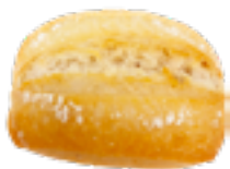
114 PCP Baguette Mini 30 gr./ud.