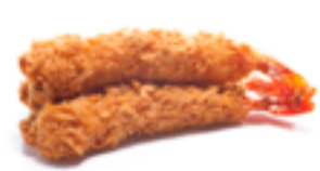
792 PR Langostino torpeda