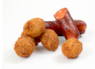
507 CR Croquetas artesanas de chorizo ahumado asturiano y ajo tostado