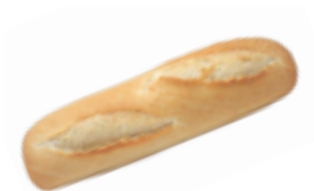
139 PCP Baguette 120 gr./ud.