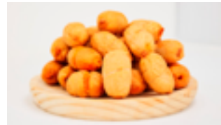
801 PCP Tequepop Queso gouda y espelette 20 gr./ud.