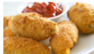
1419 FP Jalapeños empanados (Rellenos de queso cheddar)