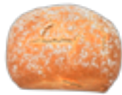
51 PCP Chapata artesana 55 gr./ud.