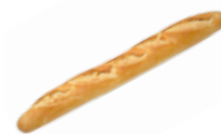
8 PCP Baguette 350 gr./ud.