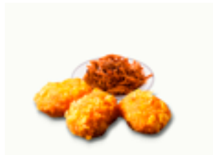
511 CR Croquetas artesanas de pulled pork BBQ (carne de cerdo desmechada con salsa barbacoa)