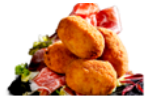
502 PCP Croquetas artesanas de jamón Ibérico