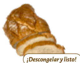
6 PCP Pan tosta payés 1 kg./ud.