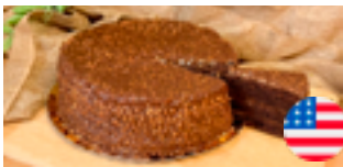
755 PCP Torta americana Ferrero 14 porciones