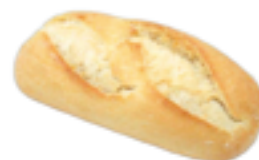
122 PCP Baguette 85 gr./ud.