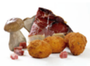
1412 CR Croquetas artesanas de boletus y jamón Ibérico