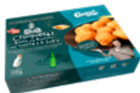
CRET 08 Croquetas de bonito del norte a la sidra