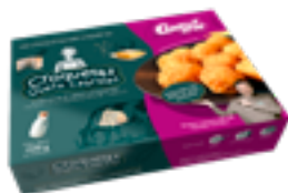
CRET 02 Croquetas de queso Cabrales