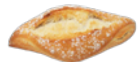
229 PCP Ración Gourmet 55 gr./ud.