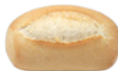
113 PCP Baguette 55 gr./ud.