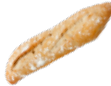
411 PCP Ración gourmet (especial bocadillos) 180 gr./ud.