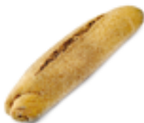
314 PCP Barra rica en fibra sin sal 280 gr./ud.