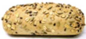
310 PCP Flautín multicereales 85 gr./ud.