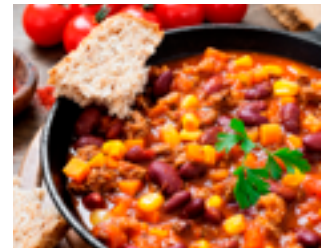
735 MX Chili con carne Carne picada de cerdo y ternera, frijoles y especias mexicanas