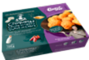
CRET 07 Croquetas de cecina de León y queso cabra