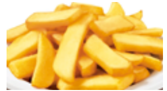
1206 BE Patata gruesa (Especial parrillas y cachopos steakhouse)