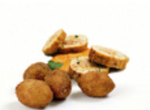
509 CR Croquetas artesanas de rollo de bonito a la sidra