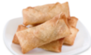
1418 FR Mini rollito primavera con verduras y setas Elaborado en España