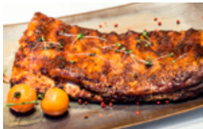
744 PR D'Gochu Ribs Tradicional Costillar de cerdo asado tradicional con chumichurri