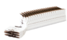
606 PCP Tarta helada crujiente nata y chocolate 1,5 l.