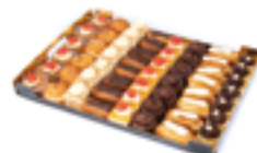
12 CO Surtido mini pasteles 30 gr./ud.