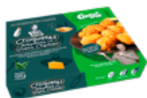
CRET 11 Croquetas jalapeños y queso Cheddar