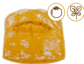
180 PCP Minipanes sabores de tomate y orégano 55 gr./ud.