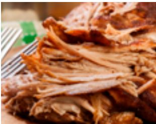
704 PR Pulled Pork BBQ Carne de cerdo desmechada con salsa BBQ al bourbon