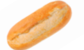
313 PCP Flautín sin sal 85 gr./ud.