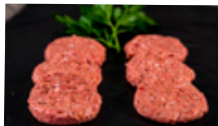
1010 HB Mini hamburguesa cerdo y ternera. HORECA MIXTA 22 gr./ud.

Deliciosas y tiernas piezas elaboradas a partir de las mejores carnes seleccionadas de cerdo, vacuno y pollo.