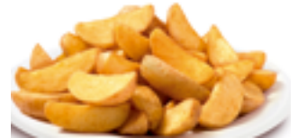
1215 BE Patata gajos deluxe (Especiada)