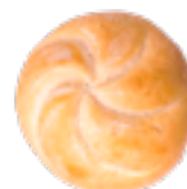
129 PCP Bollo redondo 60 gr./ud.