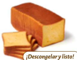
370 PCP Pan molde brioche 11x11 cm. 800 gr./ud.