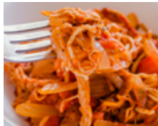
699 PR Tinga de pollo Carne de pollo desmechada, pimienta, cebolla y especias texmex