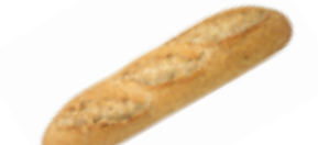
120 PCP Barra rica en fibra 280 gr./ud.