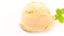
7 HEL Helado de vainilla