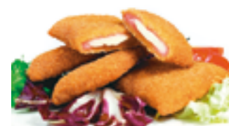
1400 PR Mini san jacobito de cerdo con queso 30 gr./ud.