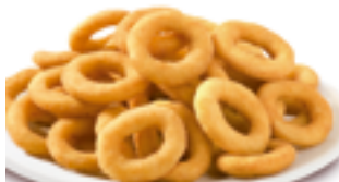
1413 PF Aros de cebolla triturada empanados 16 gr./ud.