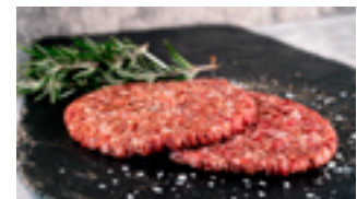
1004 HB Hamburguesa 100% vacuno mayor PASCOMPAN 110 gr./ud