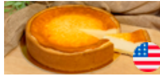
733 PCP Torta americana de queso 14 porciones