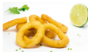
742 FR Anilla de calamar rebozada "Capricho de calamar"