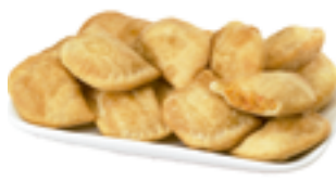
1409 FR Miniempanadilla de atún con tomate