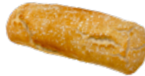
63 PCP Chapata artesana 180 gr./ud.