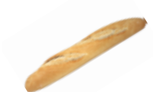
147 PCP Barra de cuarto 300 gr./ud.