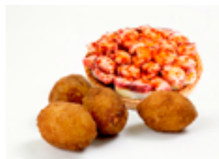
512 CR Croquetas artesanas de pulpo a la gallega