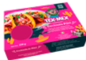
39 NTM Cochinita Pibil Carne de cerdo desmechada con especias mexicanas