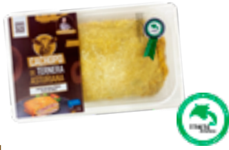
3 NTM Jamón serrano y queso tres oscos