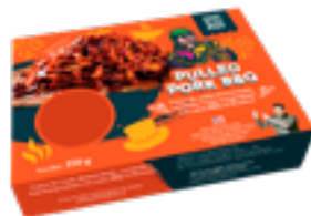
38 NTM Pulled Pork BBQ Carne de cerdo desmechada con salsa BBQ al bourbon