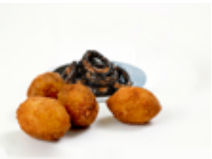
1404 CR Croquetas artesanas de calamares guisados en tinta