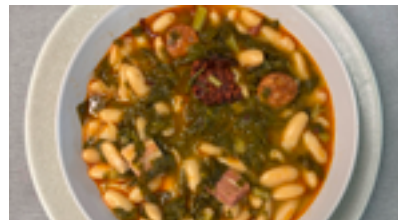
47 CP Pote asturiano