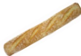
413 PCP Barra artesana 360 gr./ud.