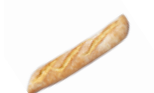
128 PCC Barra gourmet 350 gr./ud.