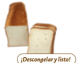
360 PCP Pan molde XXL 1 kg./ud.