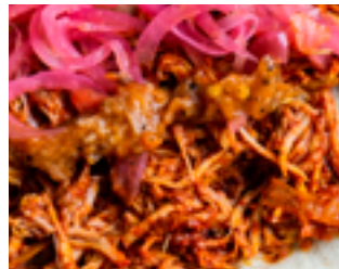
720 PR Cochinita Pibil Carne de cerdo desmechada con especias mexicanas