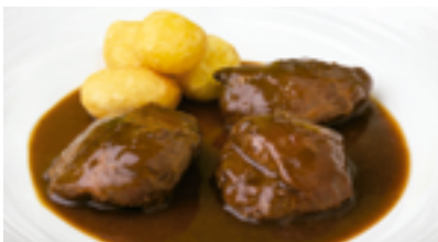
4 CP Carrilleras de cerdo guisadas al vino tinto