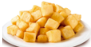
1207 BE Patata brava corte casero