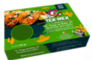
40 NTM Tinga de Pollo Carne de pollo desmechada, pimienta, cebolla y especias texmex