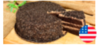
731 PCP Torta americana muerte por chocolate 14 porciones